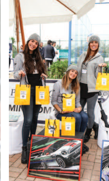
Le ragazze del Padel Forense nel corner di Acqua di Parma