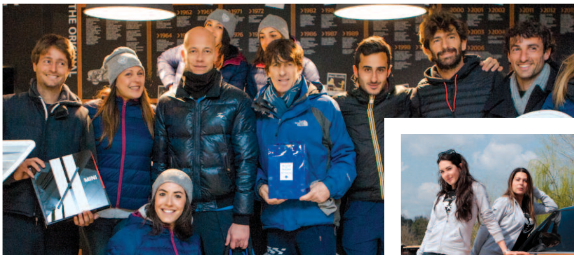
I finalisti con i direttori tecnici a fine torneo